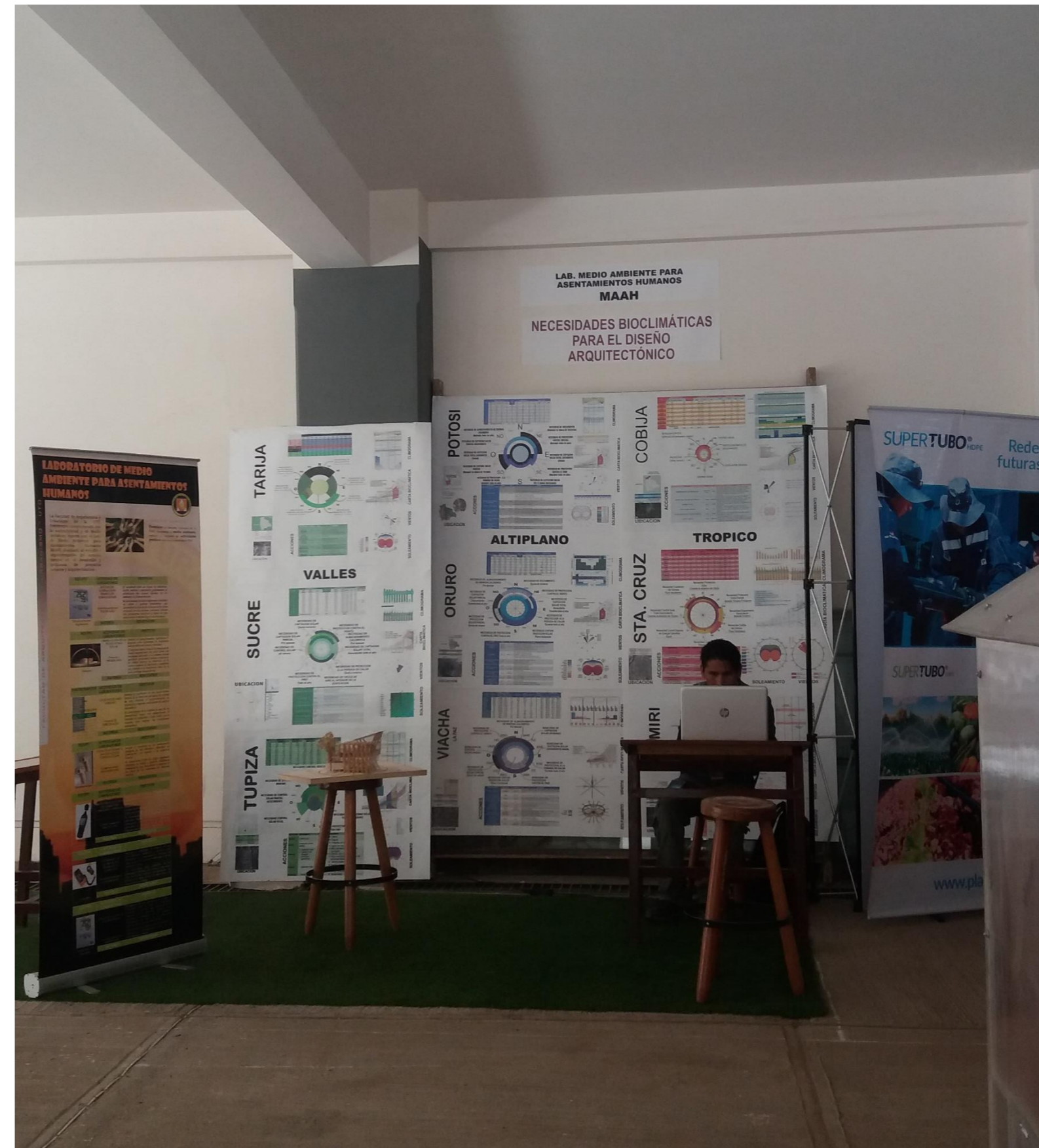
Figura N° 1. La fotografía muestra el stand preparado por el Laboratorio de MAAH