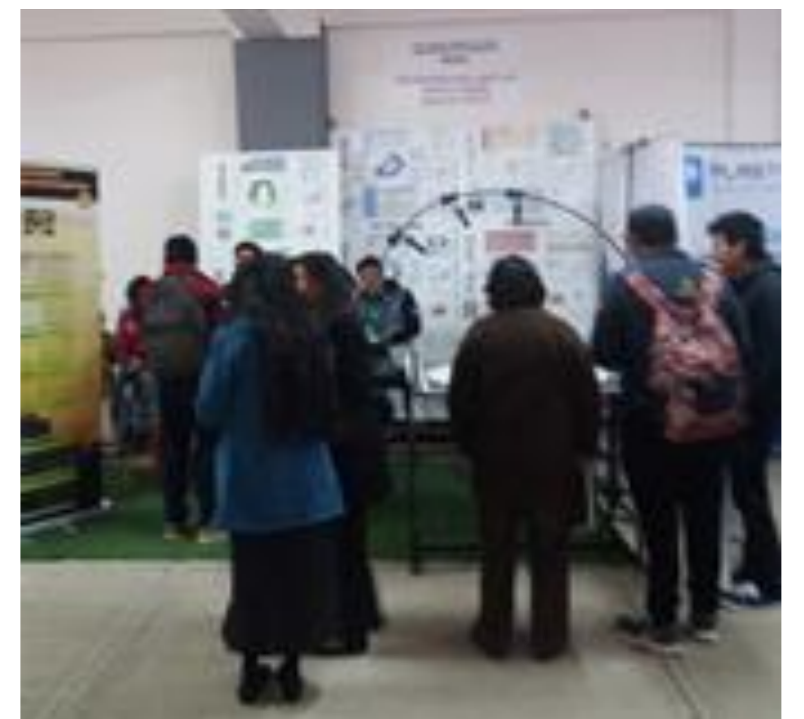
Figura N° 2. La fotografía muestra la afluencia de los visitantes alrededor del Heliodón en el stand preparado por el Lab. de MAAH