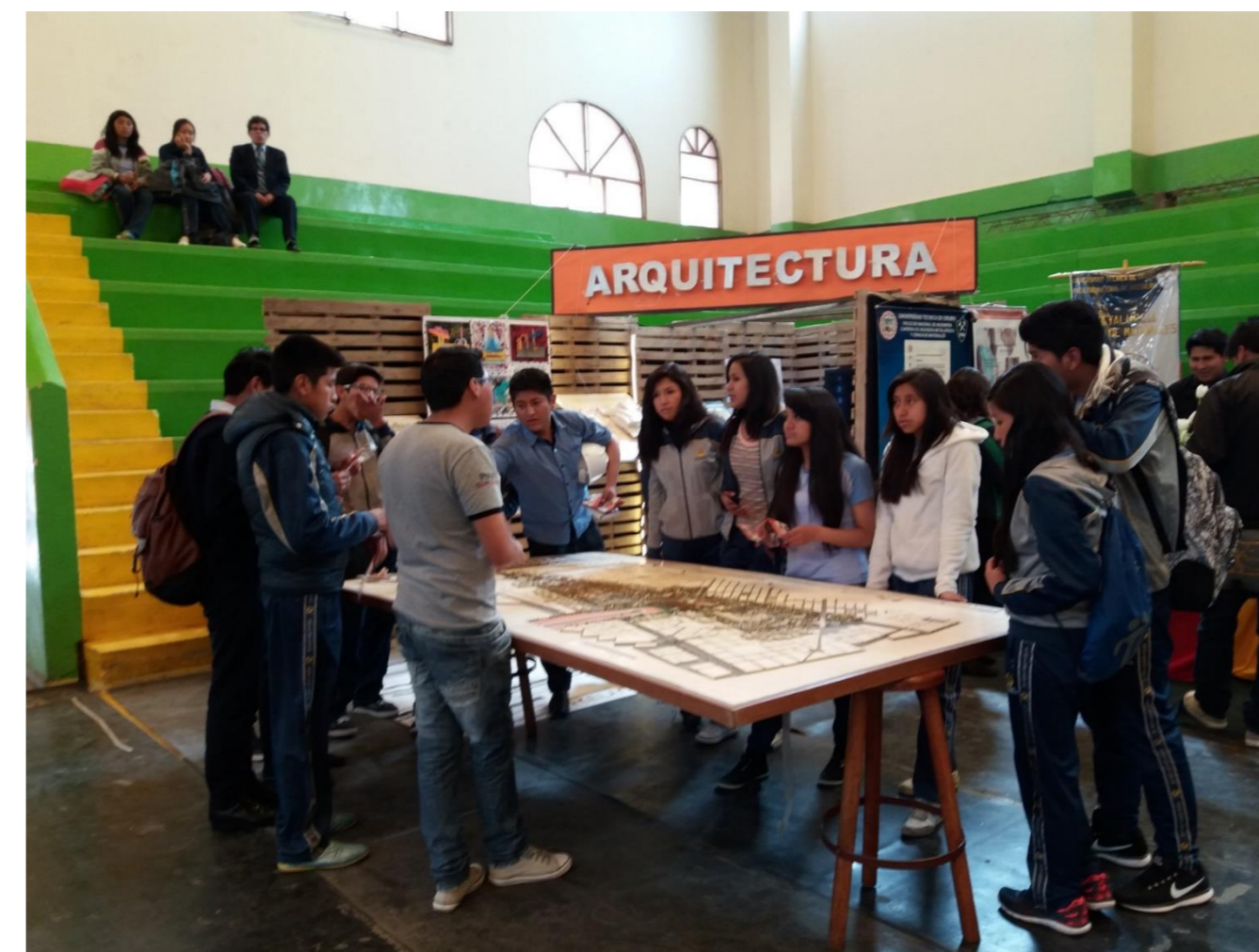
Figura N° 3. La fotografía muestra la vista de estudiantes de secundaria y la explicación sobre la carrera a cargo de un universitario.