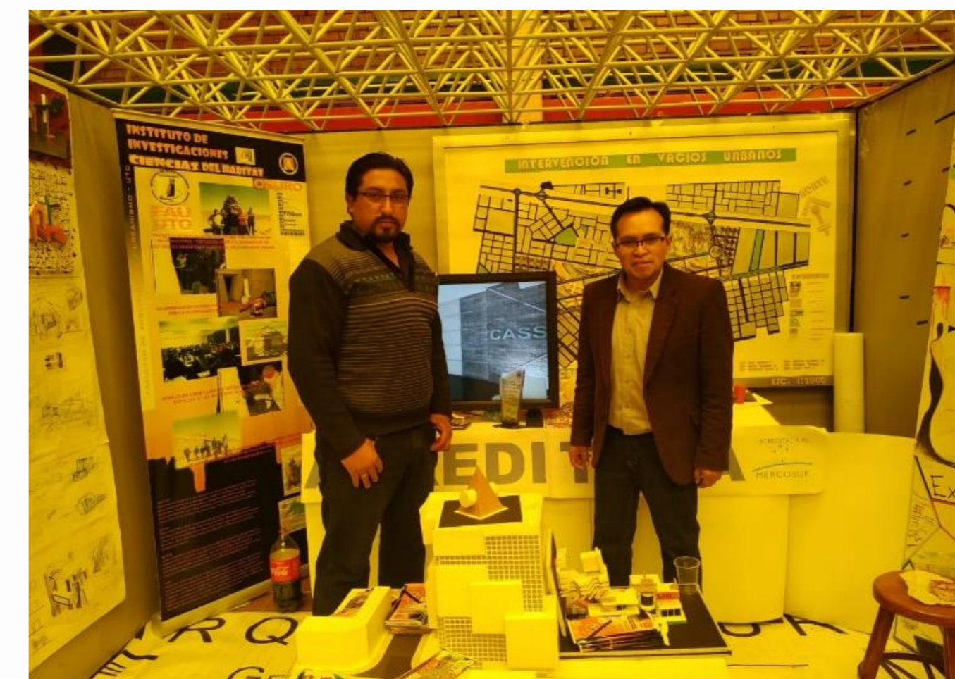
Figura N° 5. La fotografía muestra la vista principal del stand concluido para Feria Profesiografica 2019