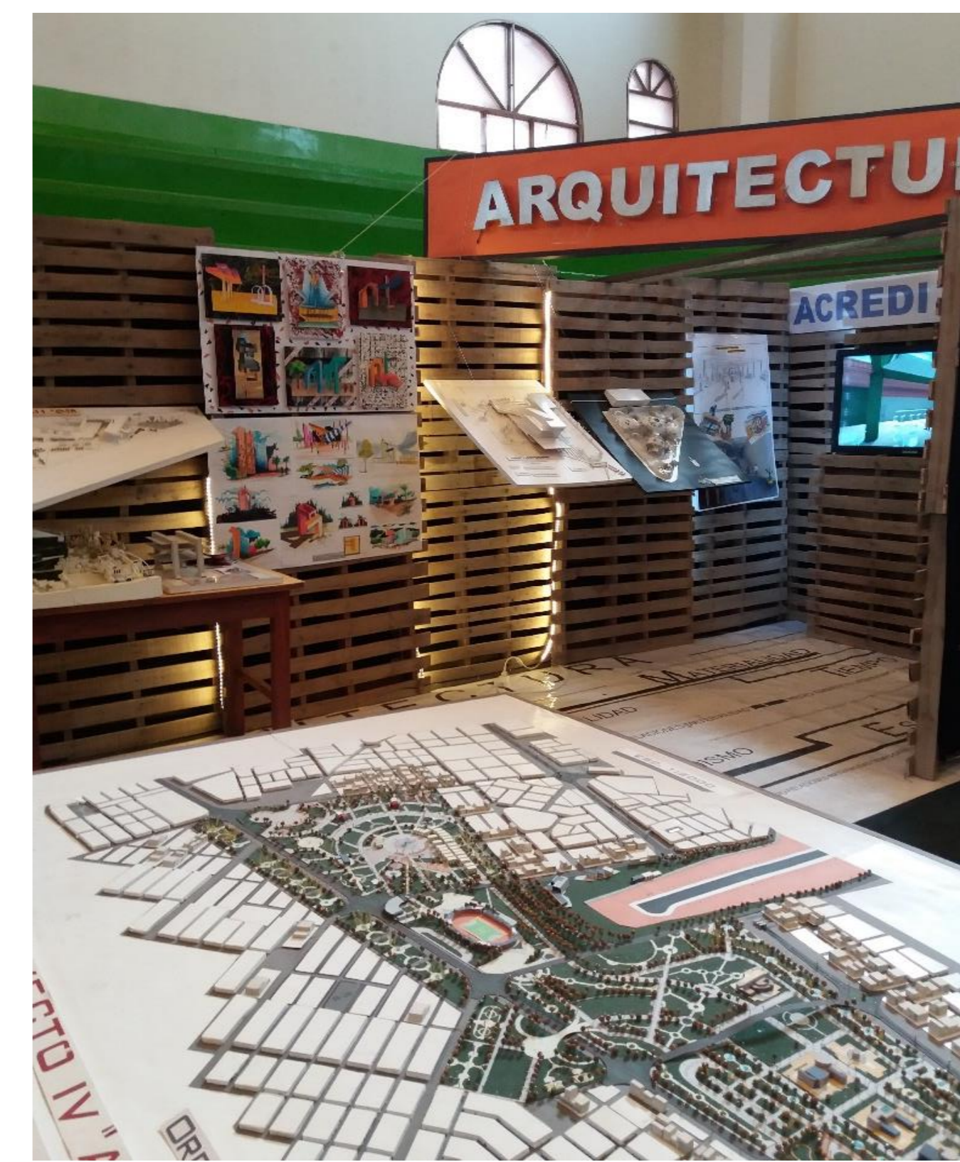
Figura N° 5. La fotografía muestra la vista principal del stand concluido para Feria Profesiografica 2018