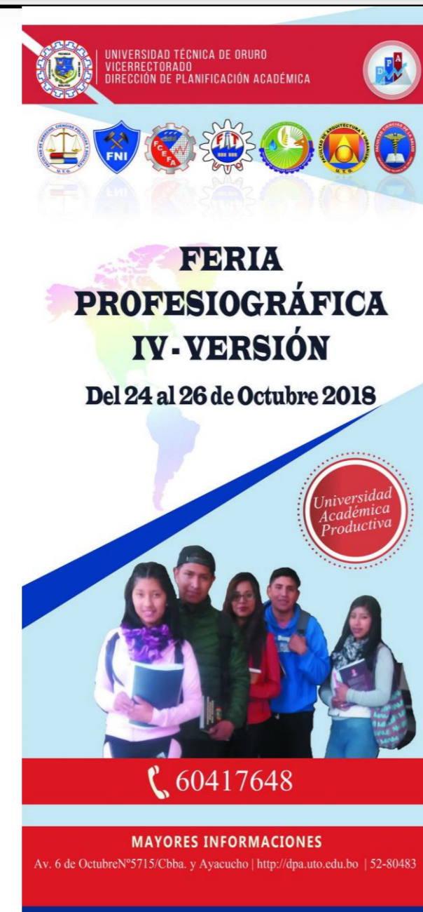
Figura N° 6. La fotografía muestra el tríptico para la participación en la Feria Profesiográfica 2018