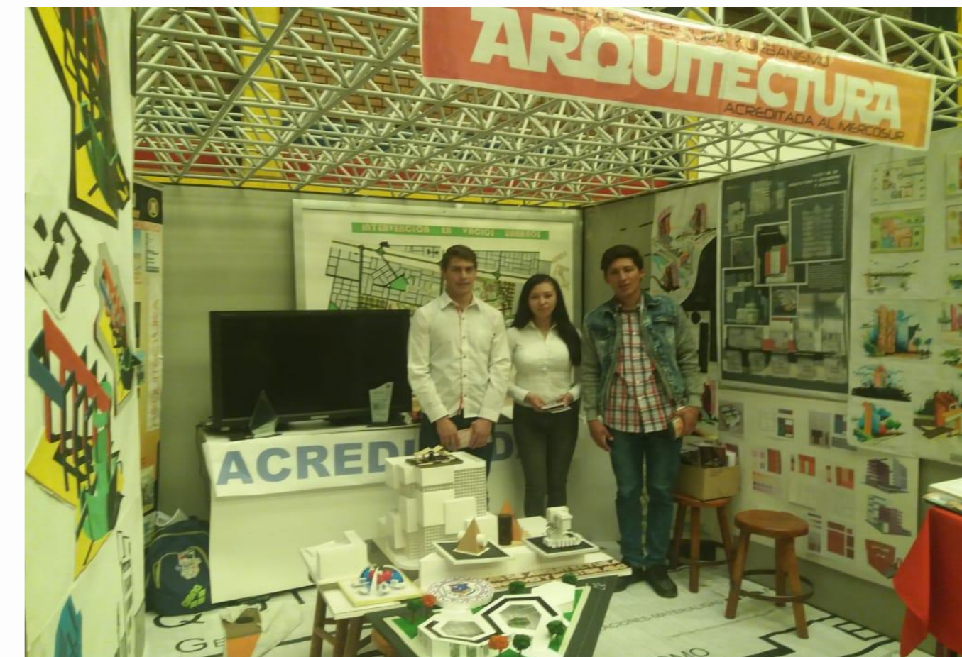
Figura N° 1. La fotografía muestra la vista del stand, a cargo de los jefes de laboratorio y estudiantes de la FAU.