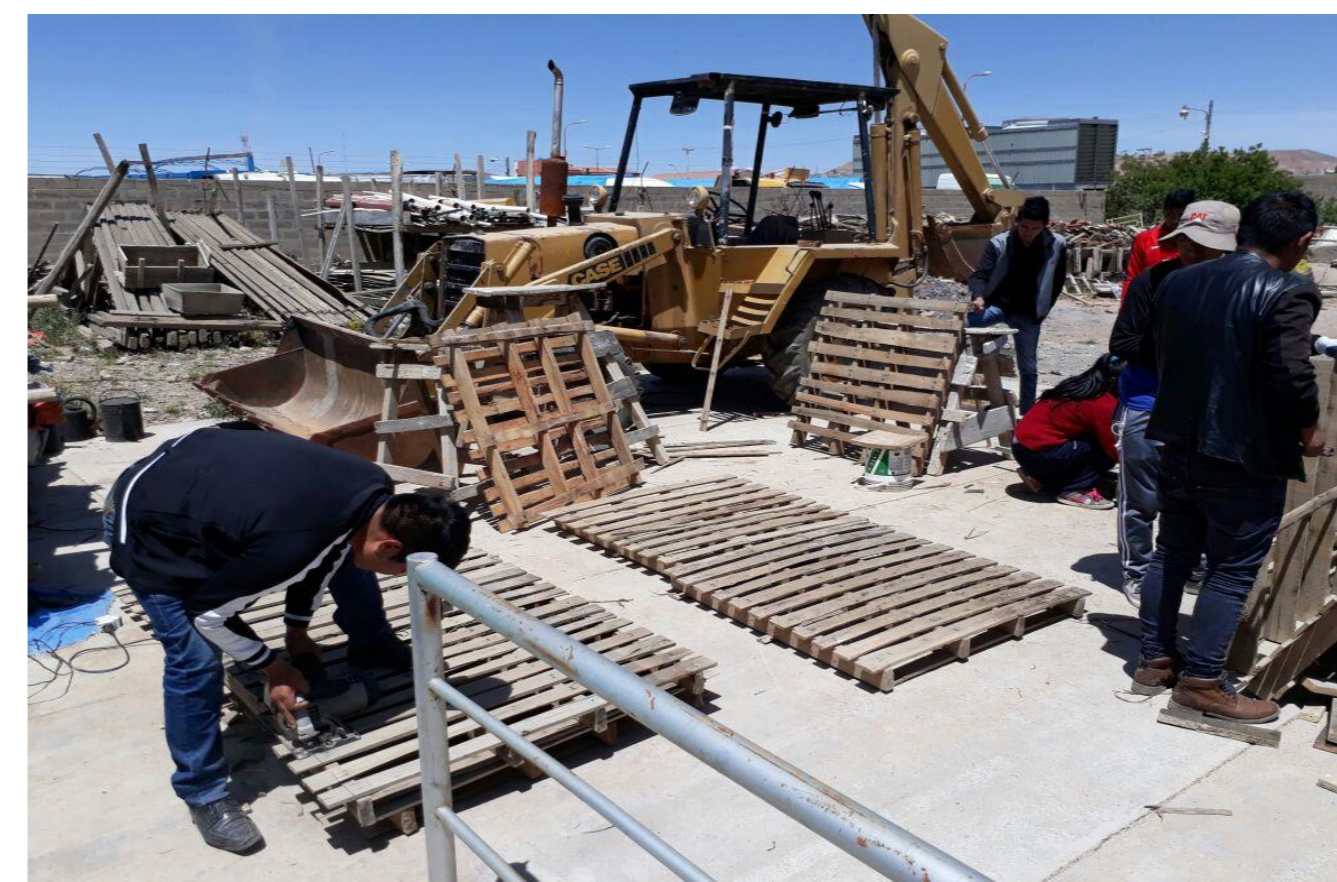
Figura N° 1. La fotografía muestra la vista del acondicionado de los pallets para el armado del stand, a cargo de los estudiantes de la FAU.