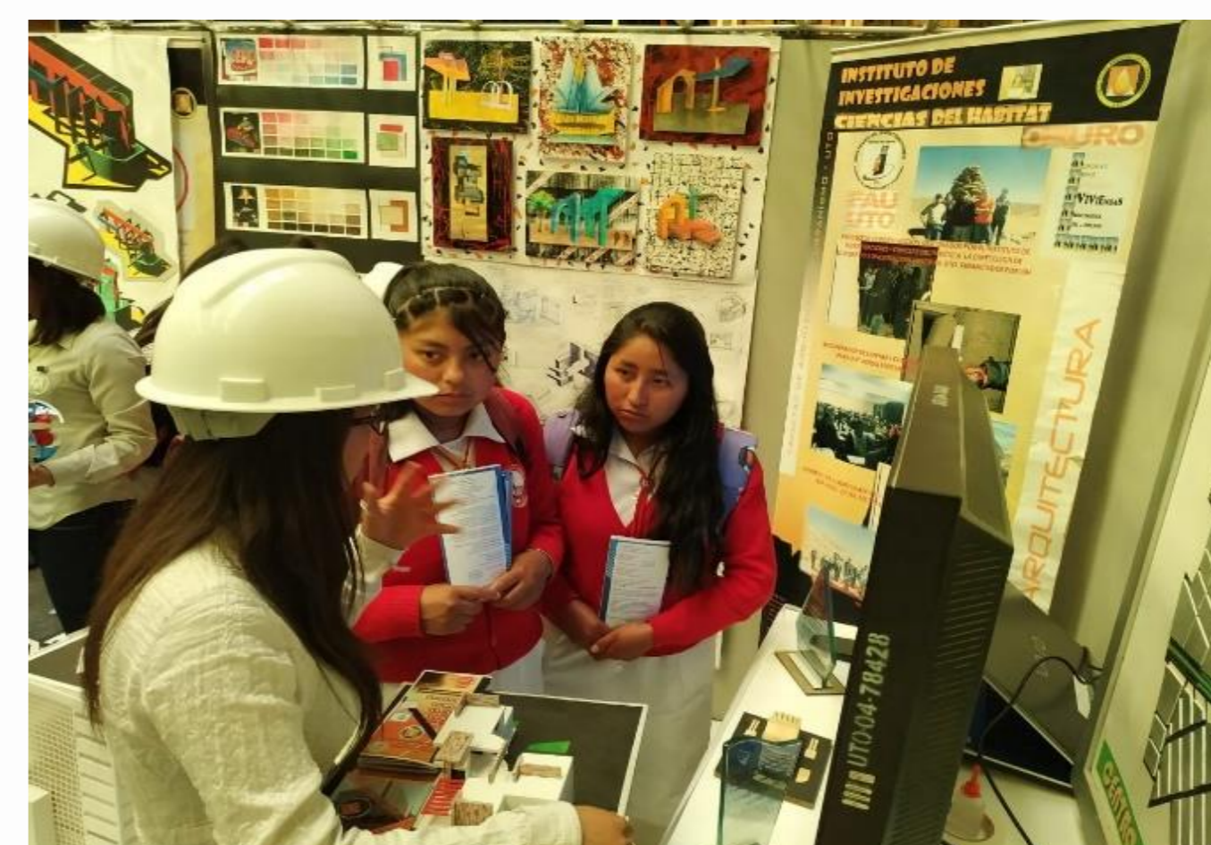
Figura N° 2. La fotografía muestra la vista de estudiantes de secundaria y la explicación sobre la carrera a cargo de una universitaria.