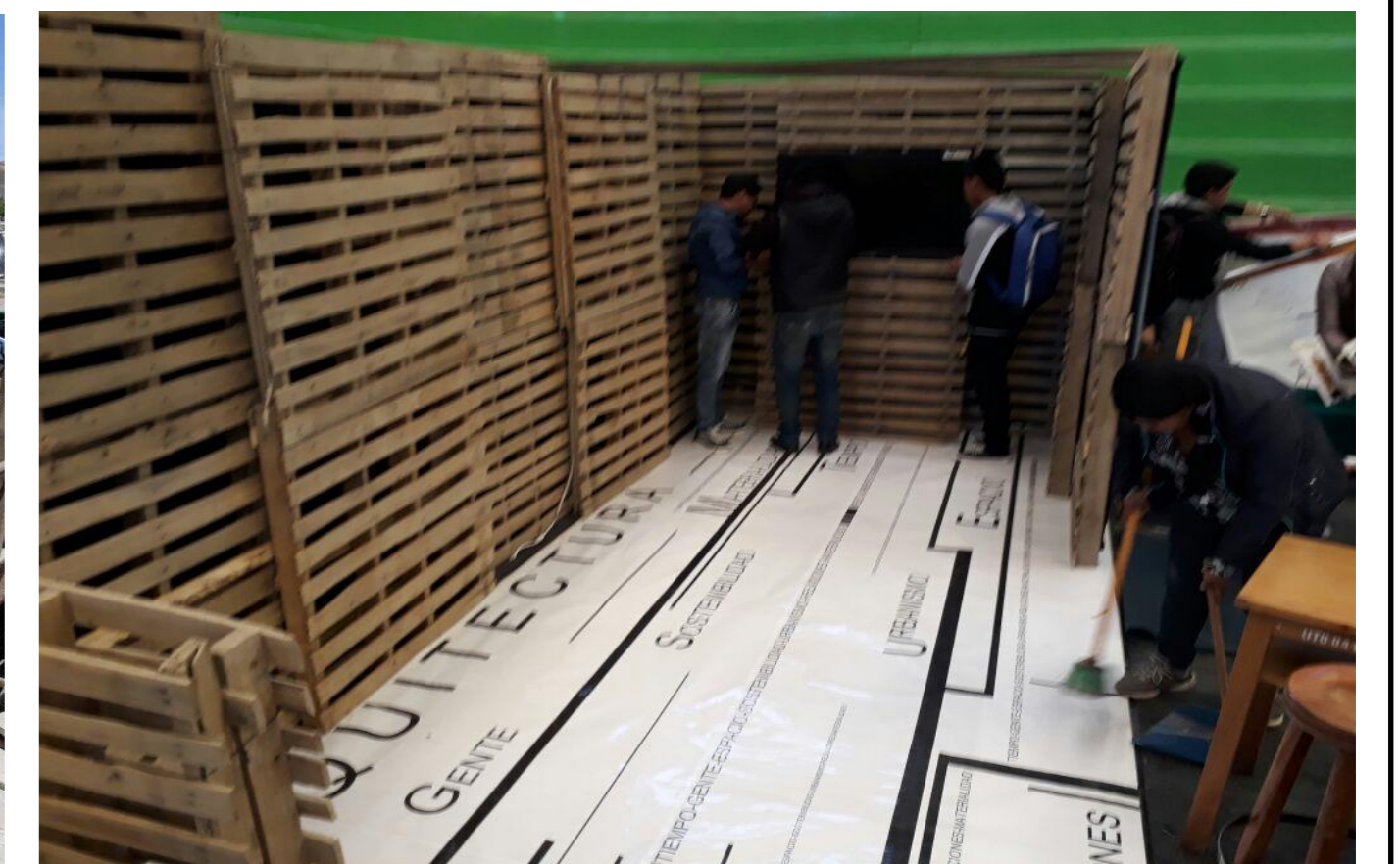
Figura N° 2. La fotografía muestra el armado del stand, para la presentación en la feria Profesiográfica.