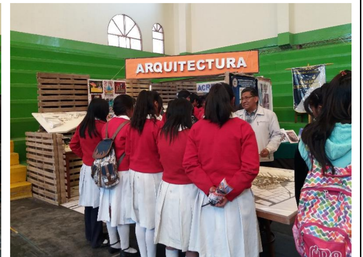
Figura N° 4. La fotografía muestra la vista de estudiantes de secundaria y la explicación sobre la carrera a cargo de un docente.