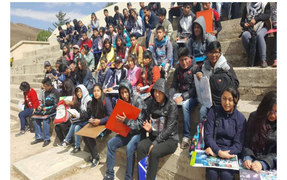
La ciudad universitaria