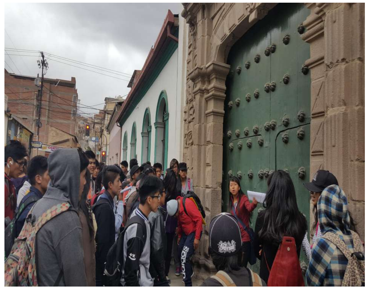
La Waca del Socavón /Monumento Minero