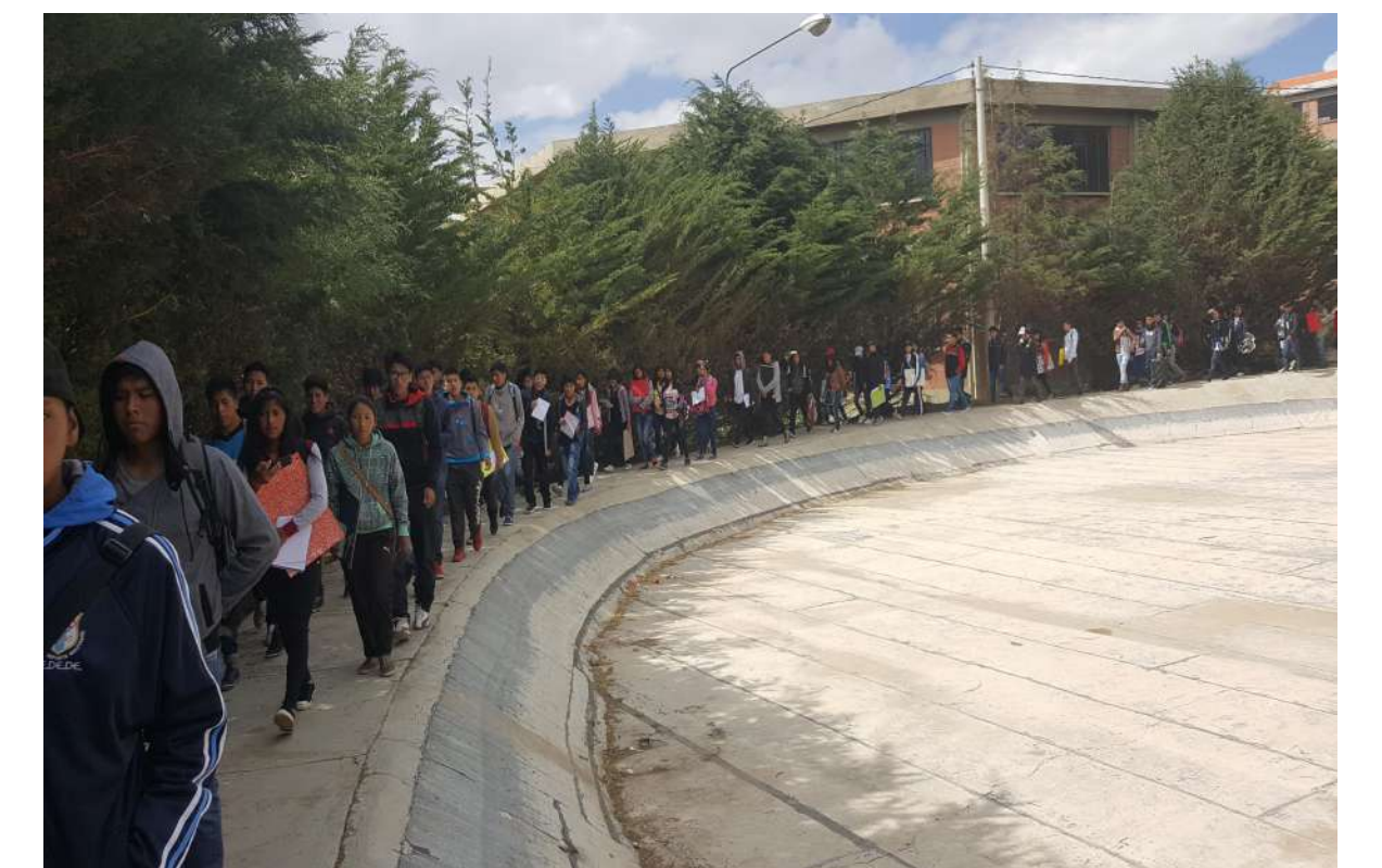
La ciudad universitaria