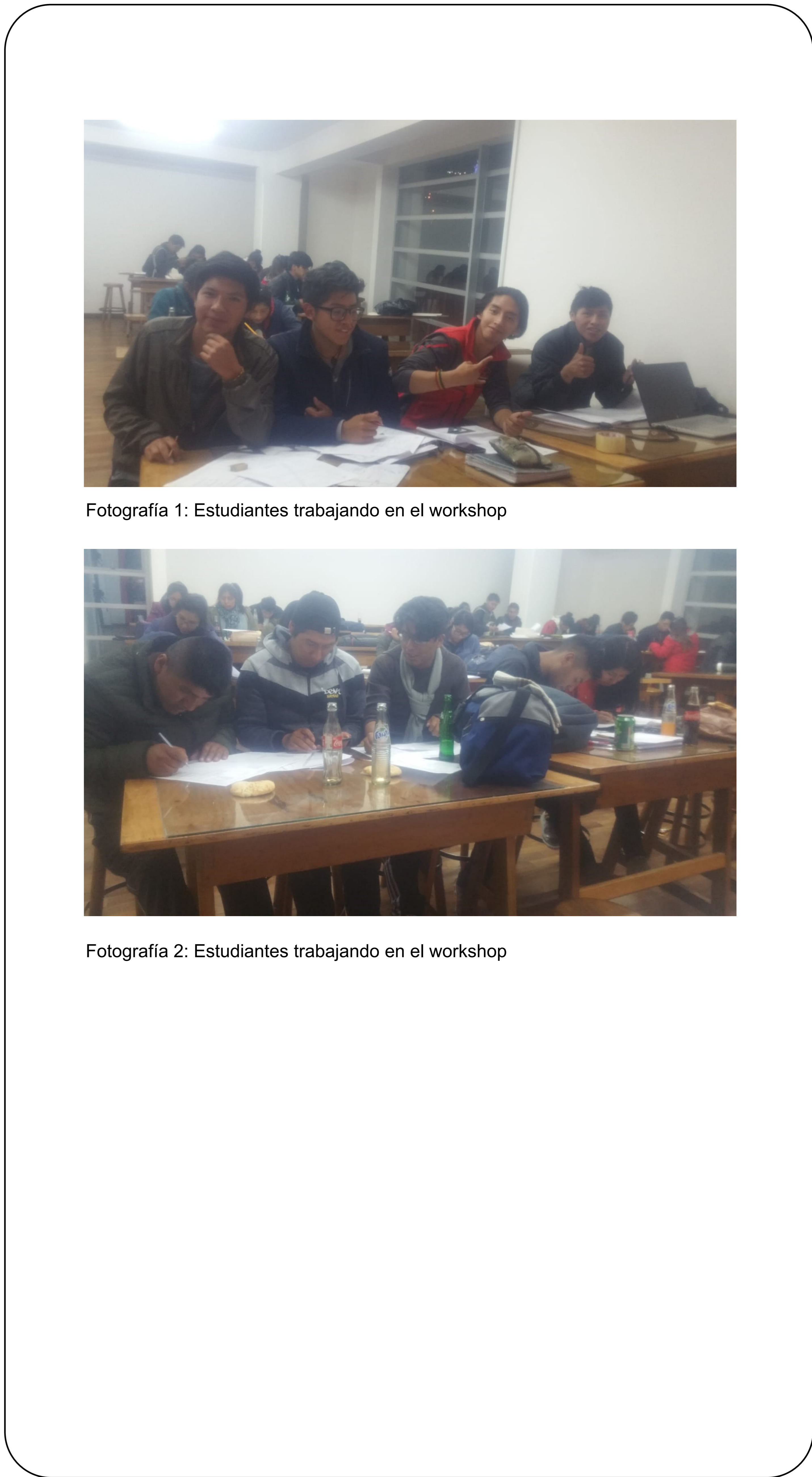
Fotografía 1: Estudiantes trabajando en el workshop