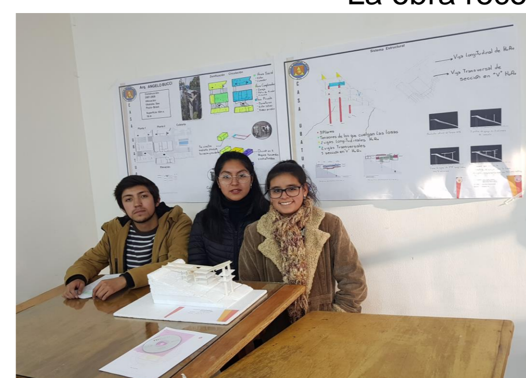
La obra reconstruida