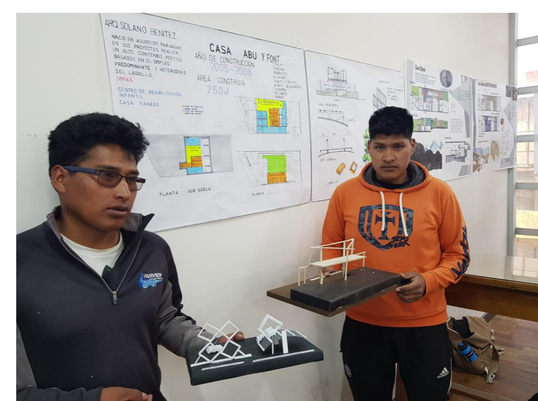
La obra reconstruida