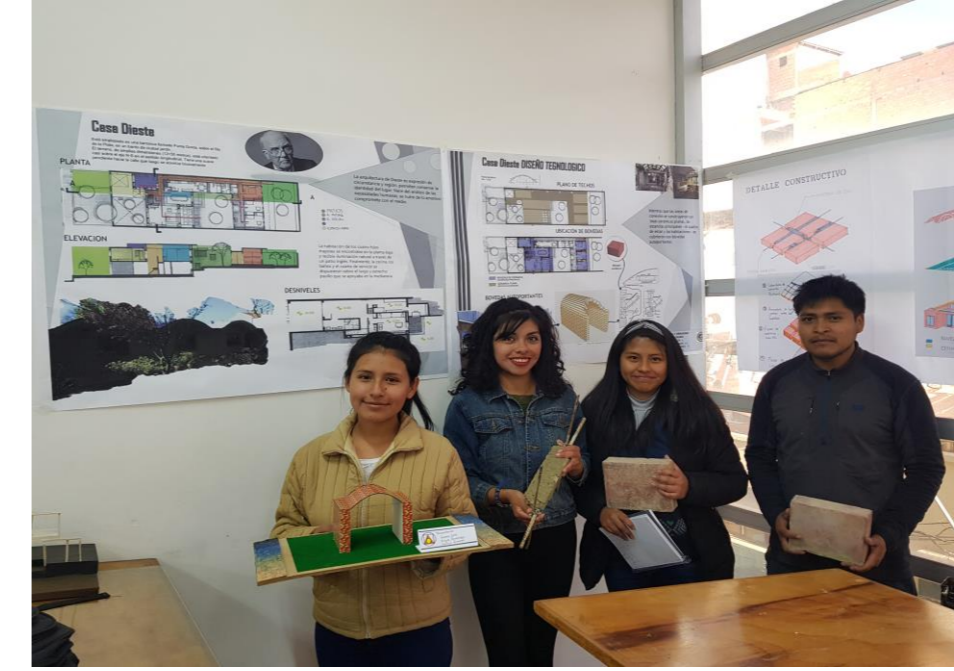
La obra reconstruida