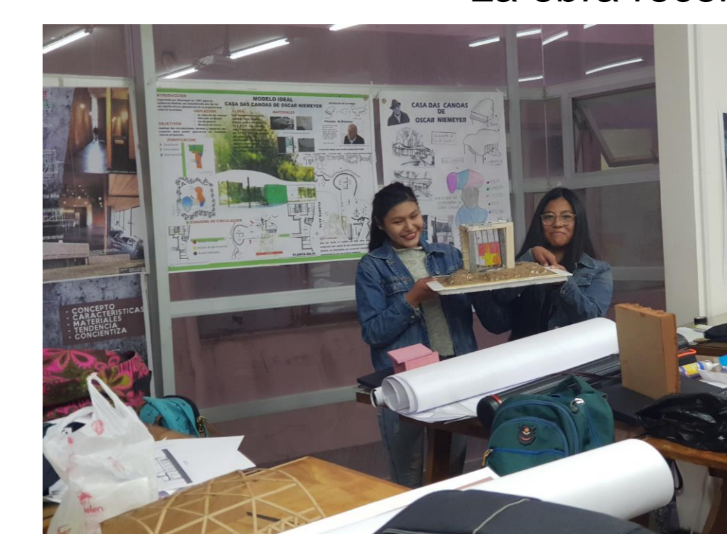
La obra reconstruida