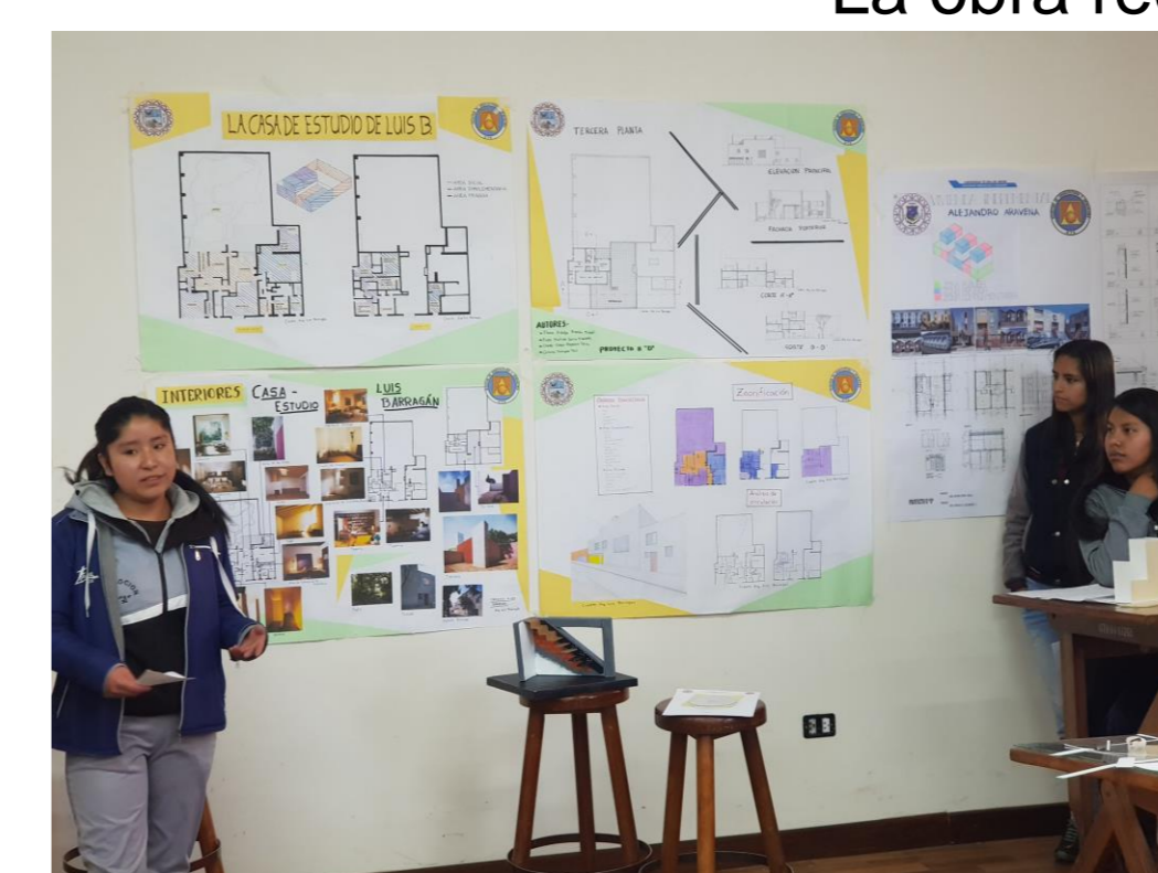
La obra reconstruida