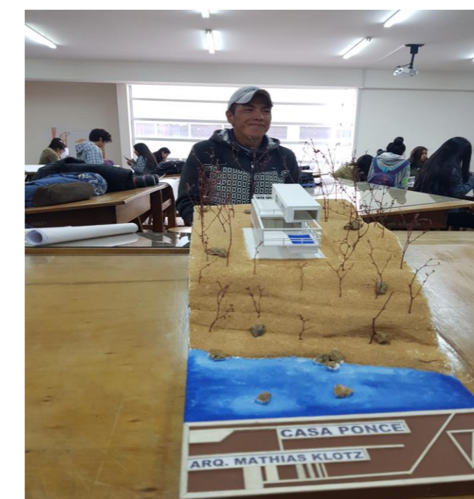
La obra reconstruida