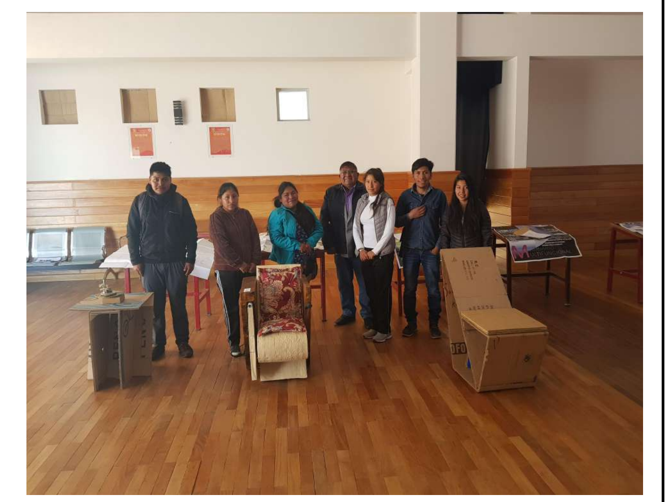
Los tres primeros lugares