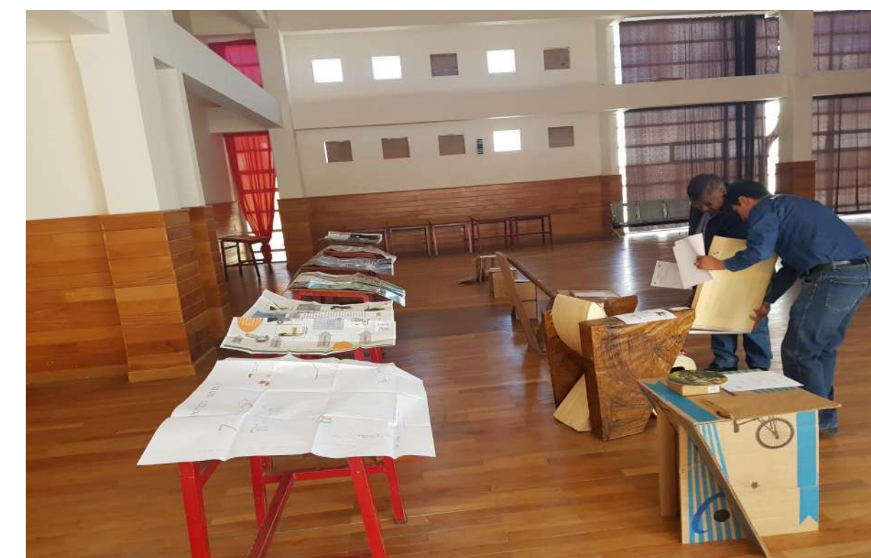
Evaluación del Tribunal