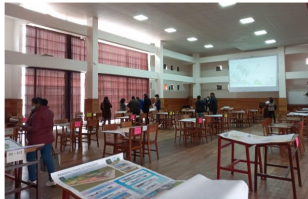
Graf. N°7. La fotografía muestra Momento de la evaluación de propuestas a cargo del Tribunal evaluador del concurso.