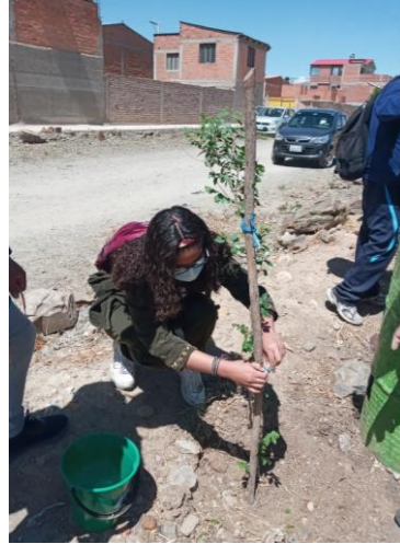
Graf. N°11. La fotografía muestra el momento de plantado de plantines en predio diseñado.