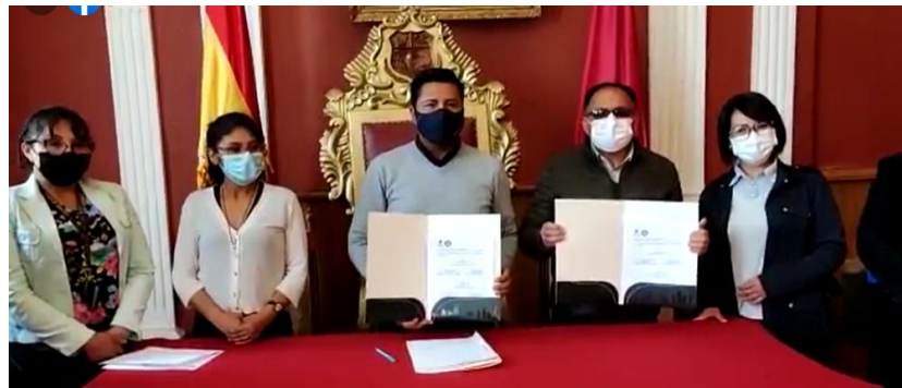
Graf. N°4. La fotografía muestra momentos del Acto de Firma de la Alianza de Entendimiento entre el Gobierno Autónomo Municipal de Oruro y la Facultad de Arquitectura y Urbanismo, en ambientes del Salón Rojo del GAMO