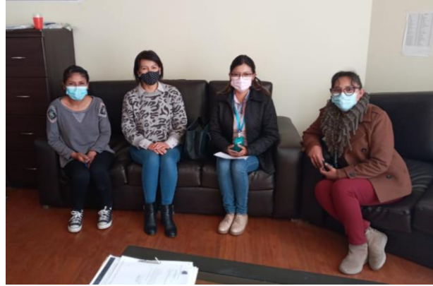
Graf. N°2 La fotografía muestra Primera reunión de coordinación en oficinas de Ordenamiento Territorial del GAMO.