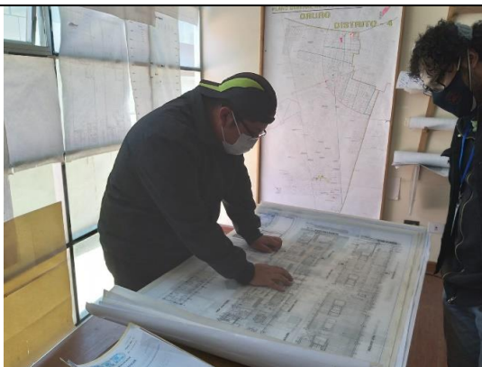
Graf. N°6. La fotografía muestra un día de trabajo en la Dirección de Ordenamiento Territorial del GAMO.