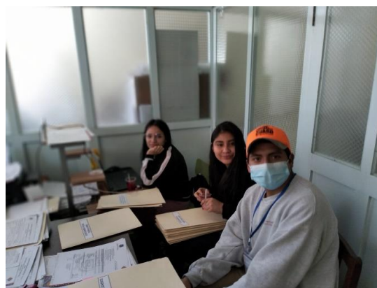
Graf. N°5. La fotografía muestra un día de trabajo en la Unidad de Salud Ambiental del GAMO.