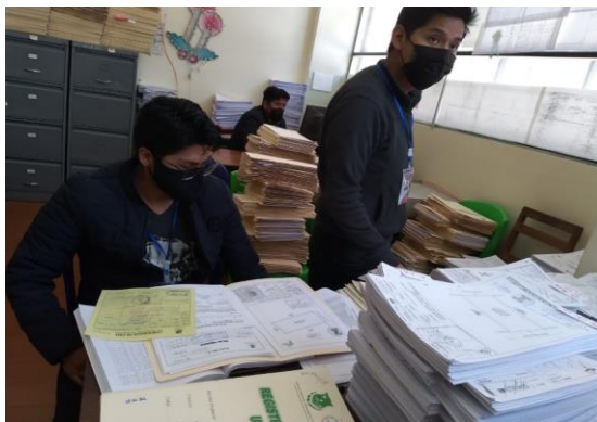
Graf. N°3. La fotografía muestra un día de trabajo en la Oficinas de Control Urbano del GAMO.