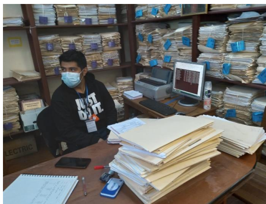
Graf. N°4. La fotografía muestra un día de trabajo en la Unidad de Catastro Urbano del GAMO.