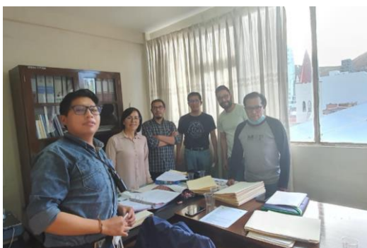
Graf. N°7. La fotografía muestra un día de reunión de coordinación de tutores por parte de la FAU con la coordinadora