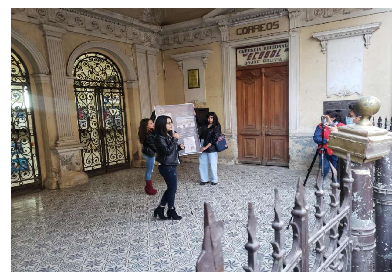
El Edificio de Correos y Telégrafos