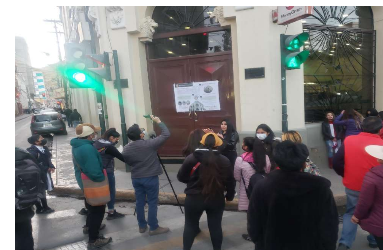
El Banco Mercantil