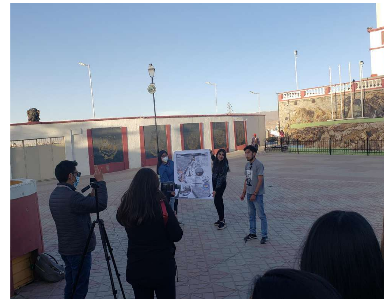
El Faro de Conchupata