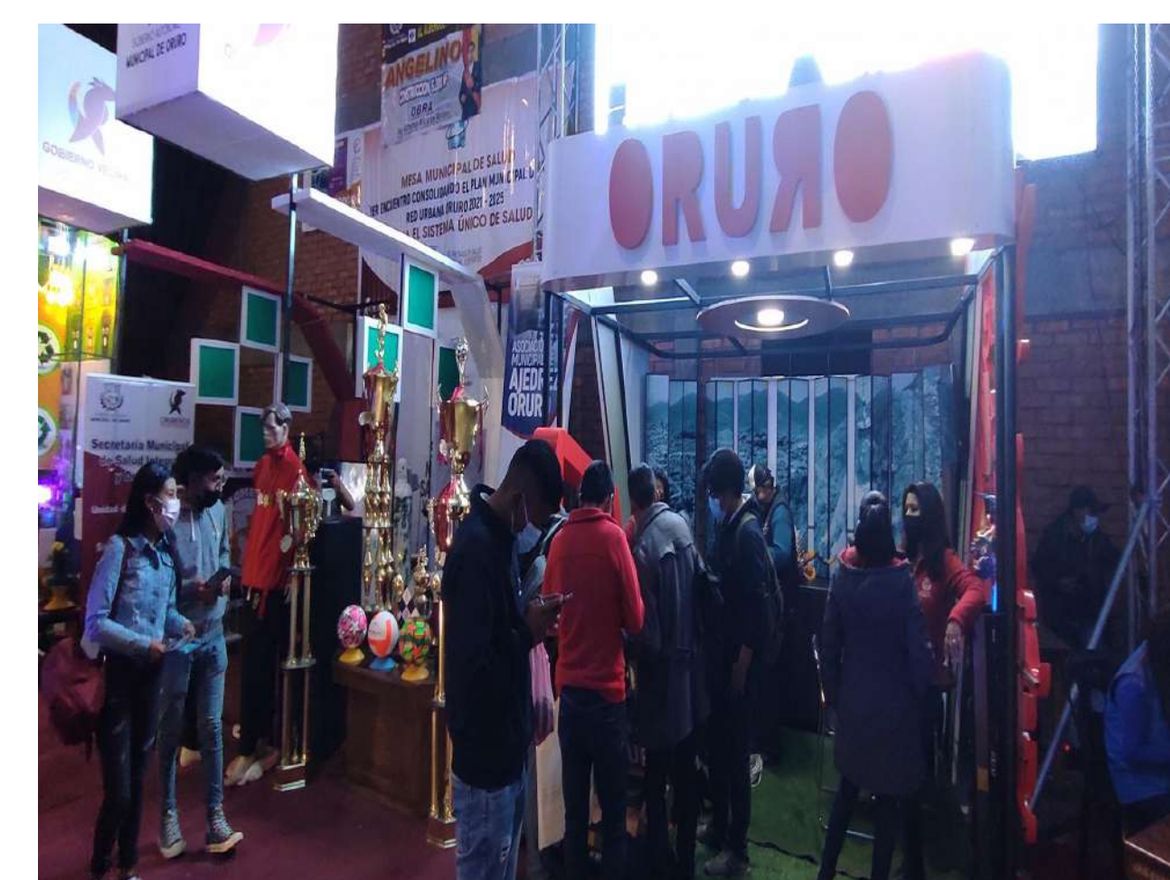
Stand Construido EXPOTECO 22