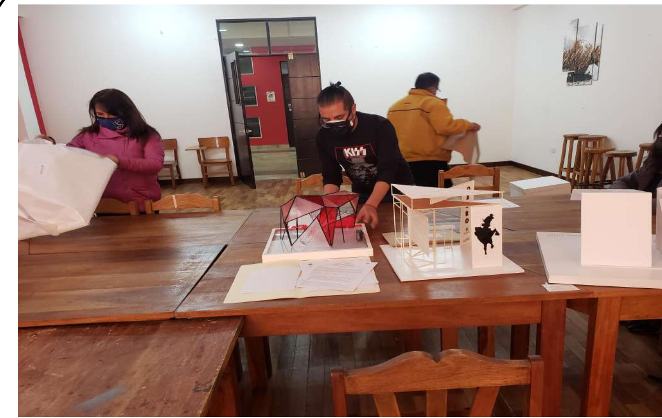
Evaluación de las propuestas