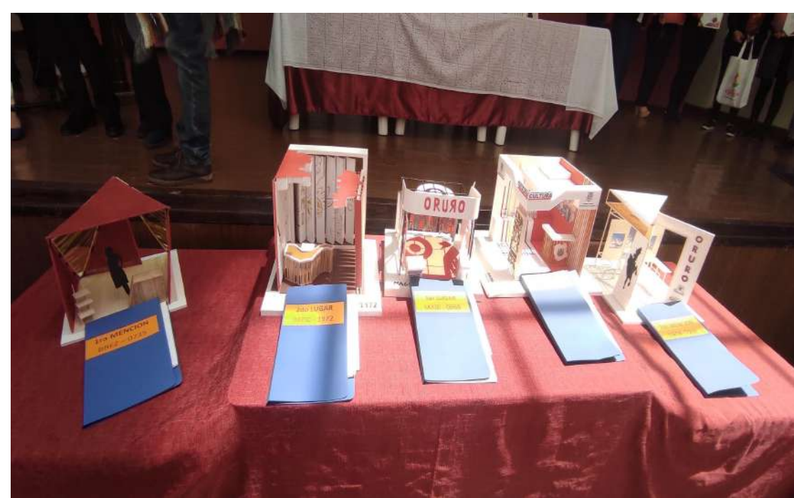
Premiación participantes Primer lugar