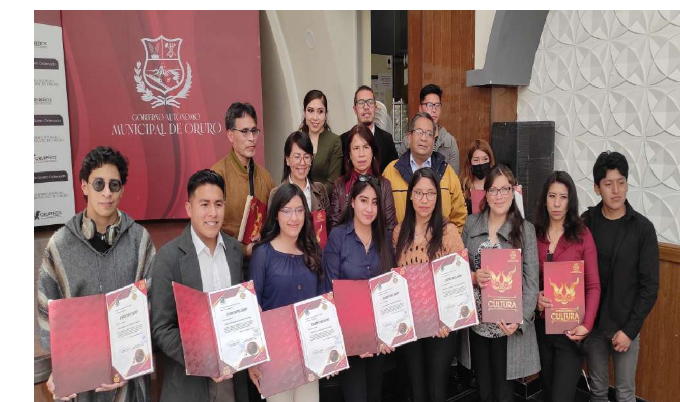
Premiación participantes, tribunales