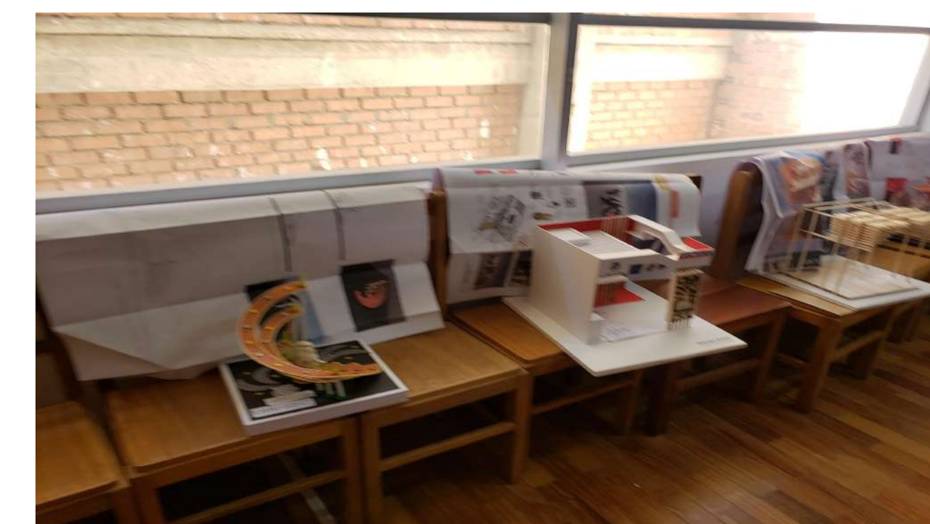
Evaluación de las propuestas