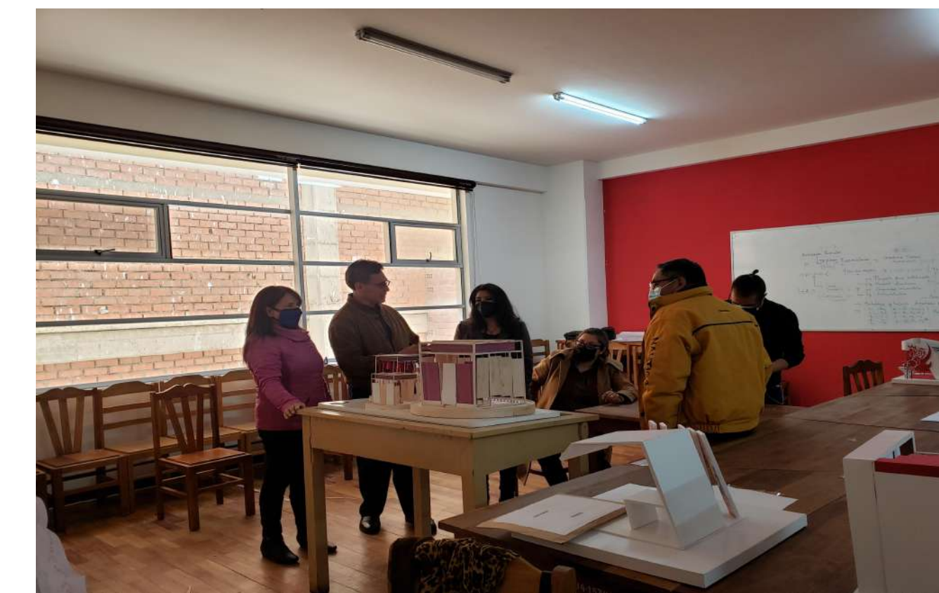
Evaluación de las propuestas