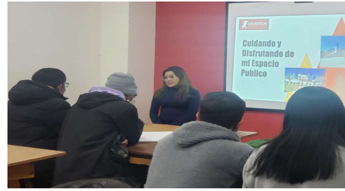
La capacitación sobre urbanismo táctico y análisis de modelos