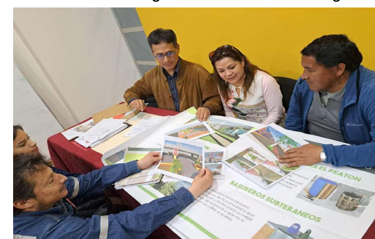
Evaluación de las propuestas