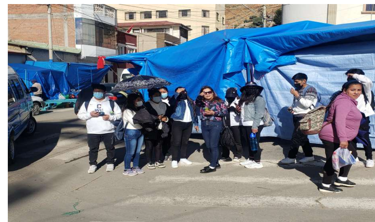
Diagnóstico de los sitios elegidos para el concurso