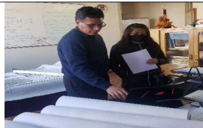
La coelaboracion urbana