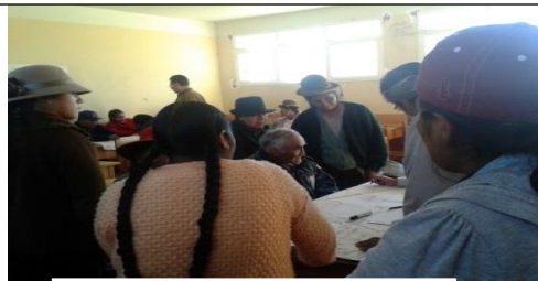
La coelaboración urbana