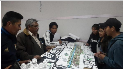
La coelaboracion urbana