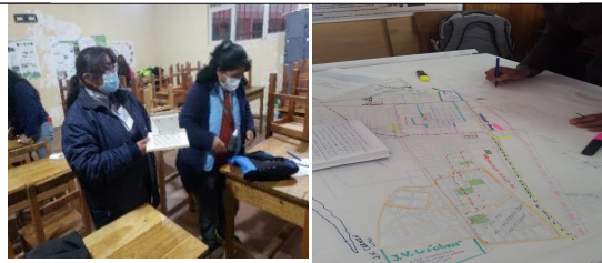
Taller de codiseño urbano