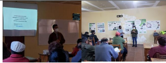
Taller de codiseño urbano