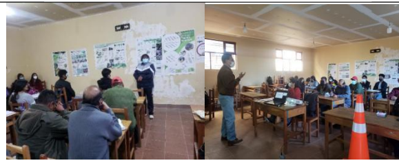
Taller de codiseño urbano