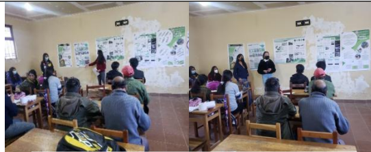
Taller de codiseño urbano