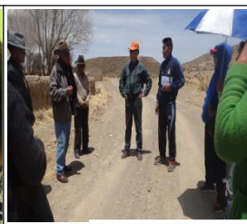
I.a coelaboración urbana