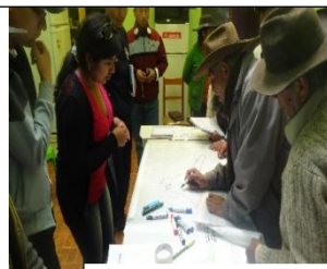
I.a coelaboración urbana