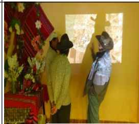
I.a coelaboración urbana