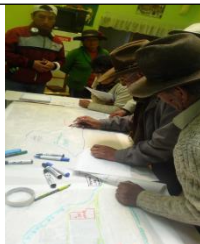
I.a coelaboración urbana