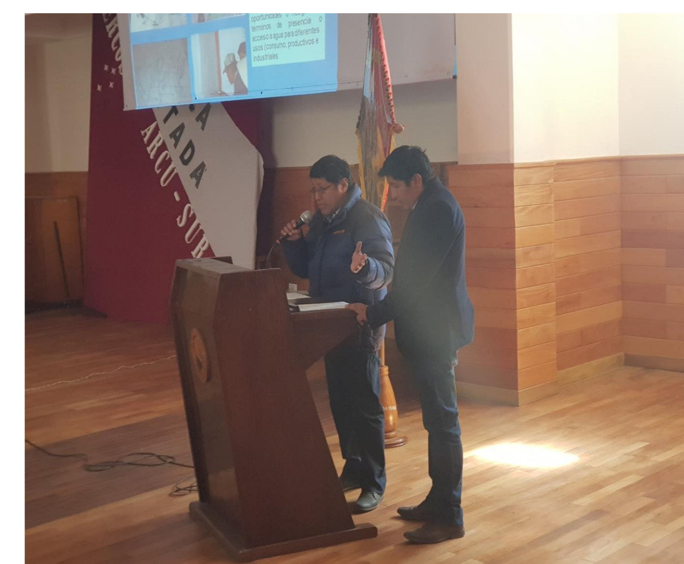
TALLER DE CAPACITACIÓN ARQ. FORTUNATO CONDORI-ARQ. FREDDY MOLLO