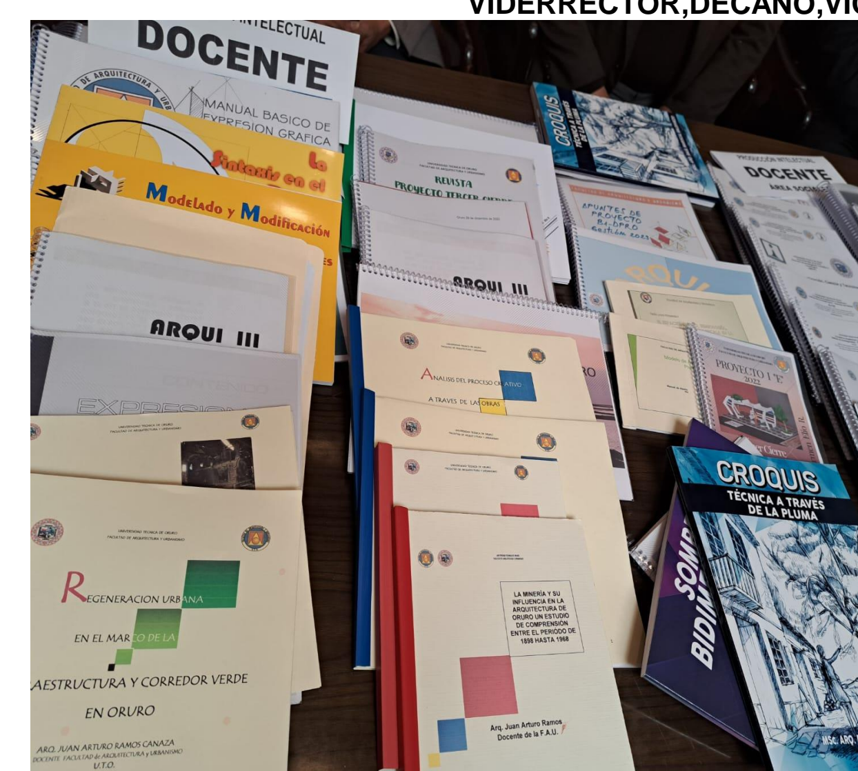
RESULTADO DE LA PRODUCCIÓN INTELECTUAL DOCENTES Y AUXILIARES AREA DE DISEÑO, SOCIALES, TECNOLOGÍA DE LA FAU