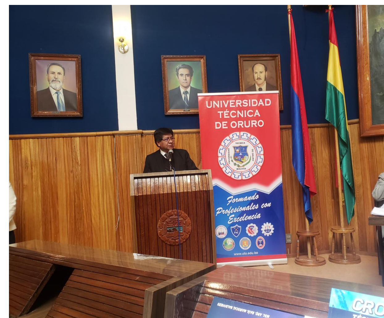
PALABRAS DEL VICERECTOR DE LA U.T.O. AUTORIDADES PRINCIPALES RECTOR, VIDERECTOR, DECANO, VICEDECANO, PRESIDENTE DE ADA DE LA FAU