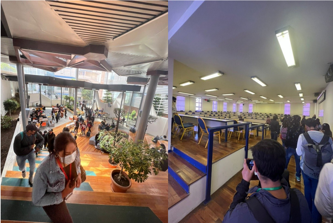
Visita a la Universidad Católica Boliviana, modelo comparativo real.