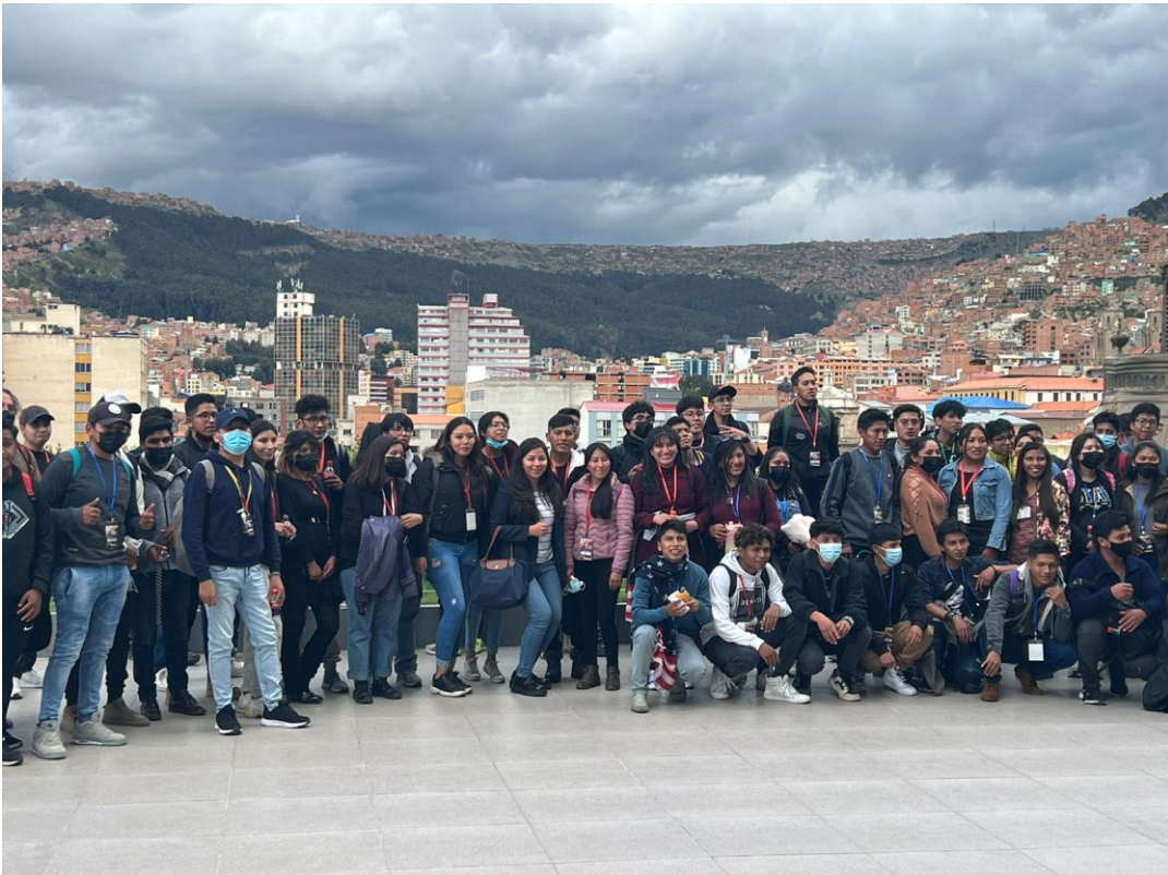
Visita a la Asamblea Legislativa Plurinacional. Innovación tecnológica.