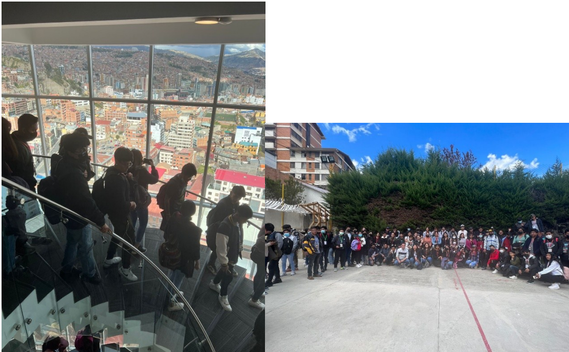
Fotografías de los tres paralelos de proyecto III.